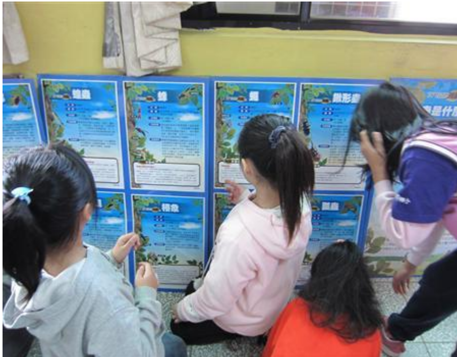
照片二內容：學生觀賞昆蟲簡介資料照片。