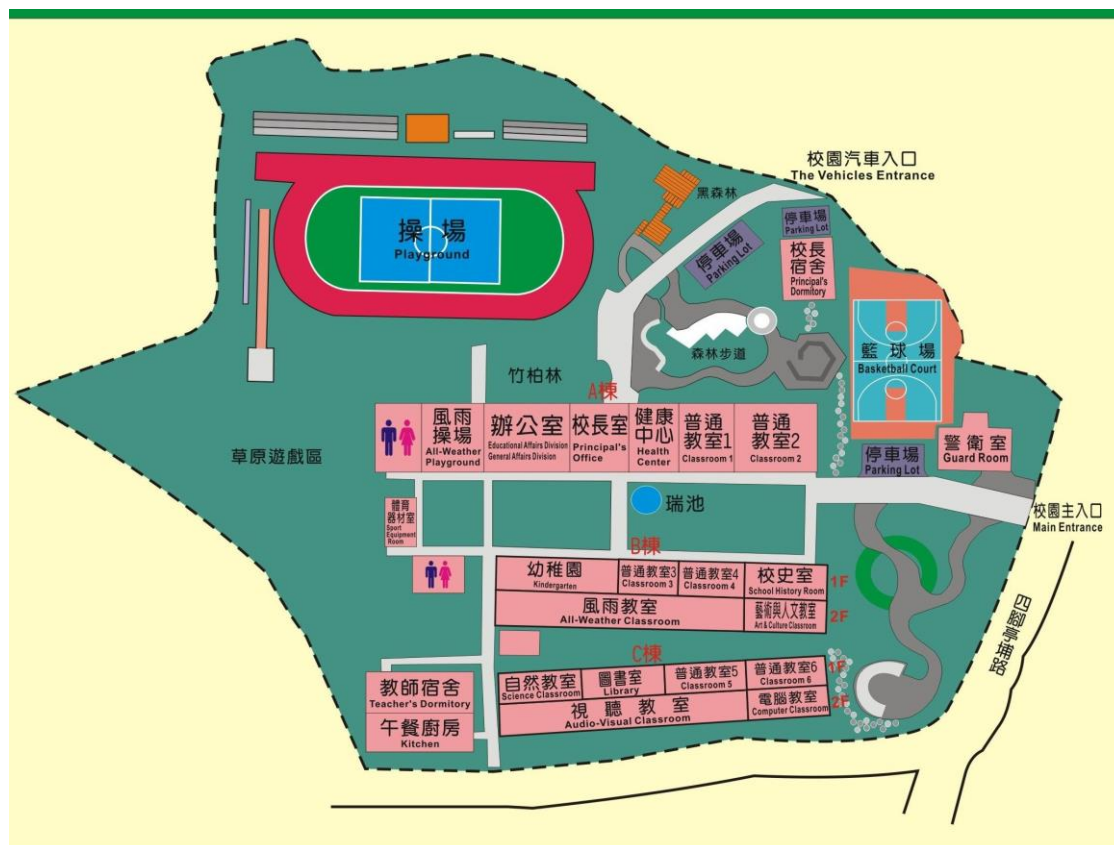
96--101 學年度各月份電費統計表