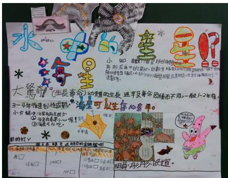
照片二內容：製作海洋生物簡報資料照片。