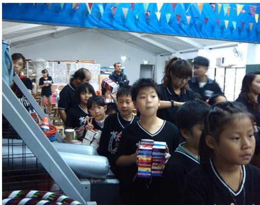
照片二內容：結合運動會表演，使用回收材料製作道具照片。