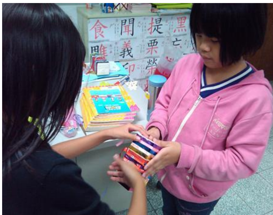
照片一內容：指導學生使用回收資源製作運動會表演道具照片。