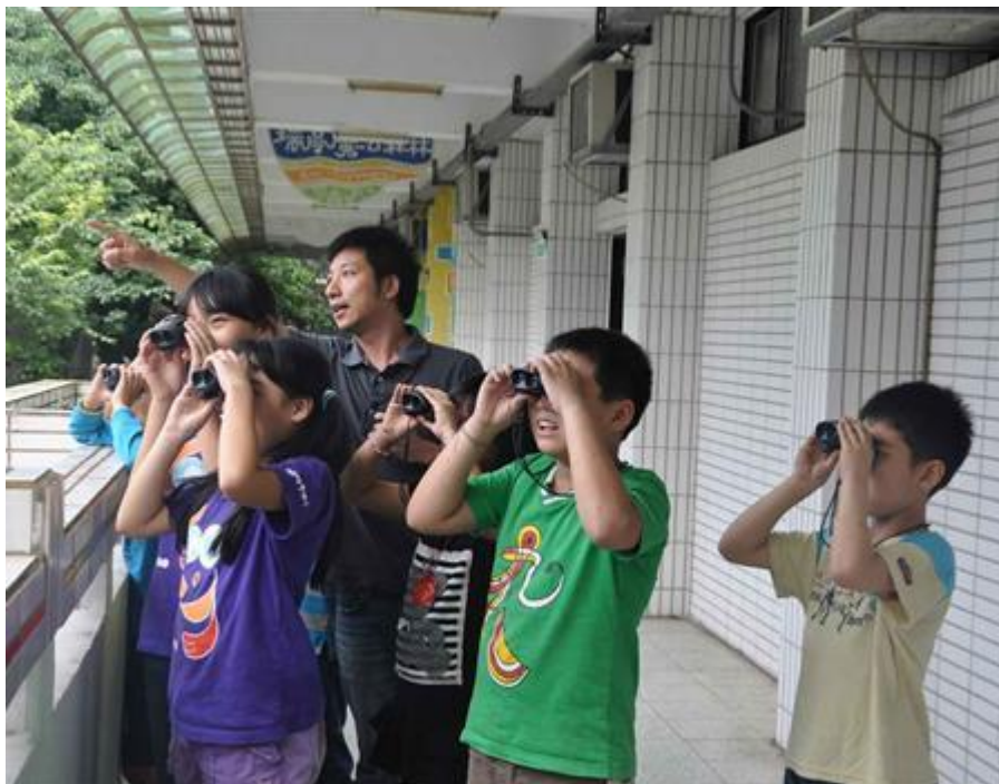
照片一內容：指導學生使用望遠鏡觀察台灣藍鵲照片。