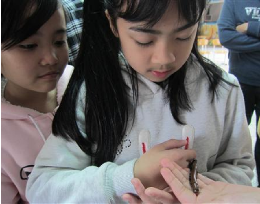
照片一內容：指導學生觀察昆蟲照片。