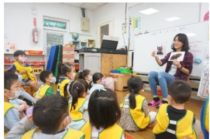
展示狗與貓咪不同情緒的表情圖片