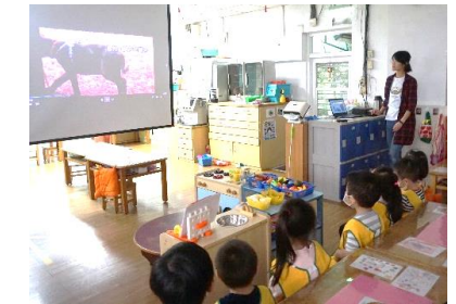
欣賞影片-狗的情緒行為