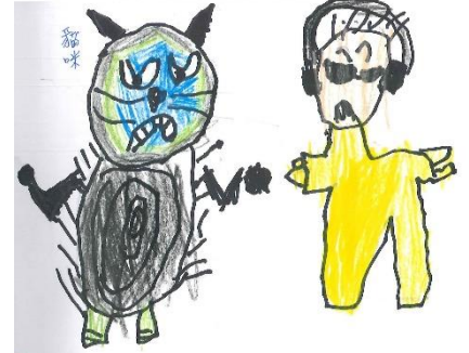
幼兒的學習單紀錄-生氣