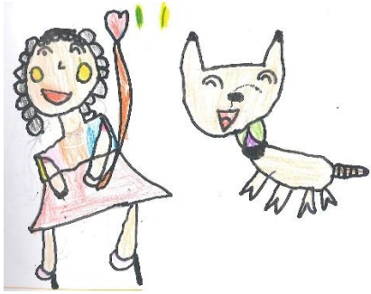
幼兒的學習單紀錄-開心