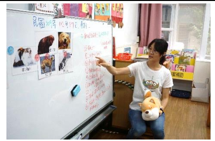
要怎麼知道動物的想法呢？請幼兒分享想法