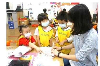
老師協助將幼兒的想法記錄下來