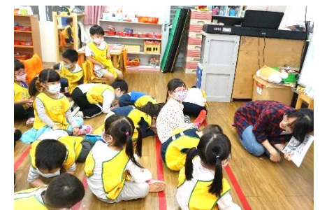
幼兒模仿動物害怕時將身體壓低並捲起身子