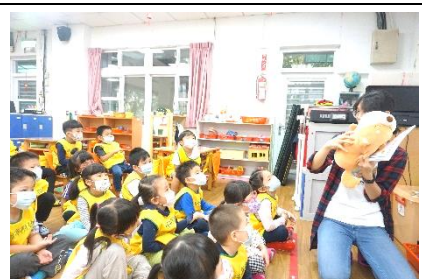
運用狗玩偶搭配說明，讓幼兒更清楚知道狗的行為變化