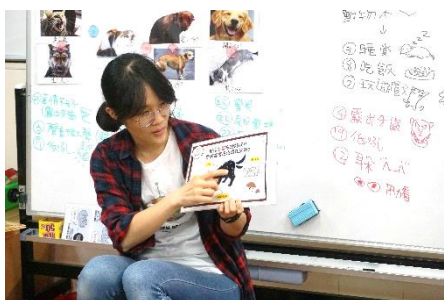
展示狗狗行為圖卡，並將幼兒觀察後的想法做統整