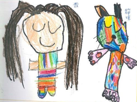
幼兒的學習單紀錄-開心