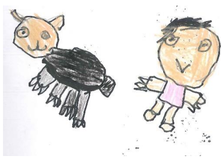
幼兒的學習單紀錄-開心