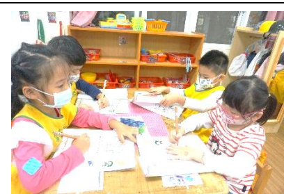
畫下自己與動物不同情緒下的表情(高興、生氣、害怕)