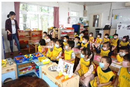
欣賞影片時與幼兒說明狗狗行為當下的情緒反應