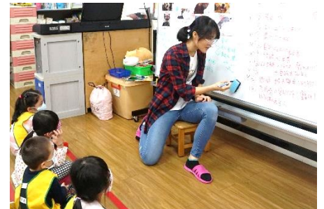
將幼兒觀察到的情緒行為反應記錄下來(生氣、難過、高興)