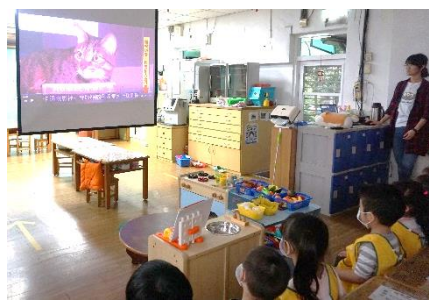
貓咪與狗狗有許多類似的行為