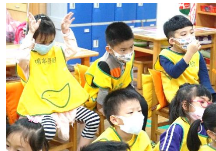
在統整動物的三種情緒行為時，幼兒也跟著模仿動作