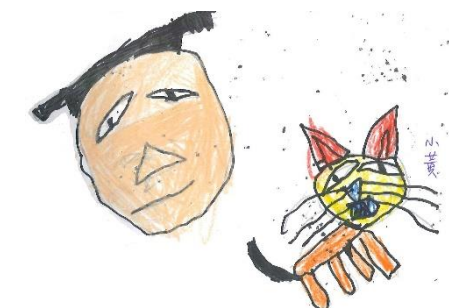
幼兒的學習單紀錄-發呆