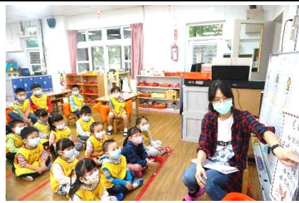
討論兒歌內容中的狗出現哪些反應