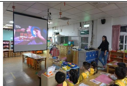
觀賞動物看醫生的影片