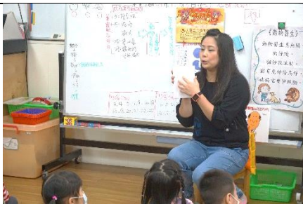
感謝小卡製作說明