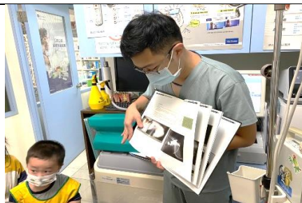
介紹有關於狗的醫學書