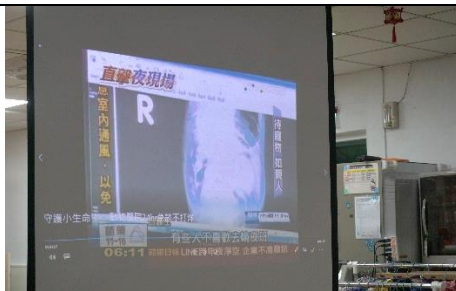
觀賞動物看醫生的影片