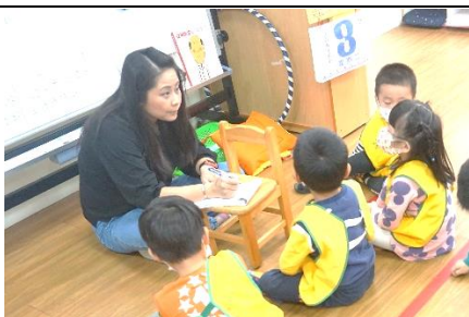
分組討論要問獸醫師的問題