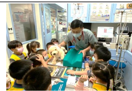
介紹狗狗照 X 光躺的墊子