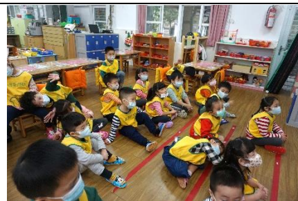
母語兒歌「動物醫生」