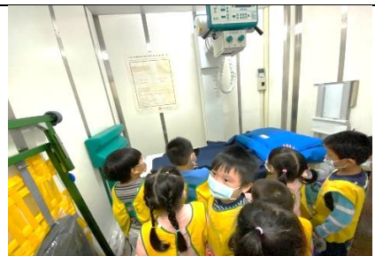
介紹動物照 X 光的地方