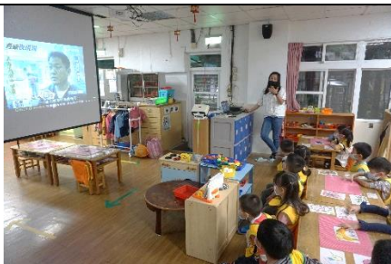
觀賞動物看醫生的影片