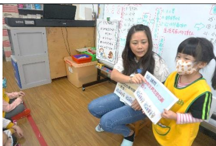
參訪前練習問問題