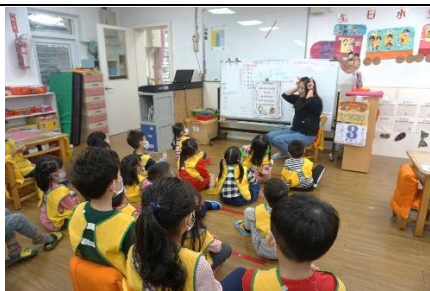
母語兒歌「動物醫生」