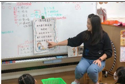
母語兒歌「動物醫生」