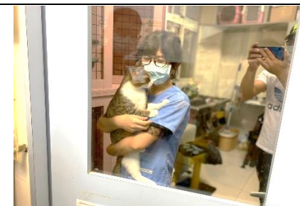
動物醫院收養的貓