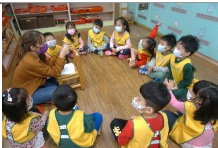
分組討論要問獸醫師的問題