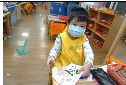
感謝卡製作—劃出喜歡的動物