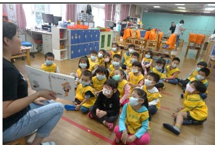
故事繪本「可以養小狗嗎？」