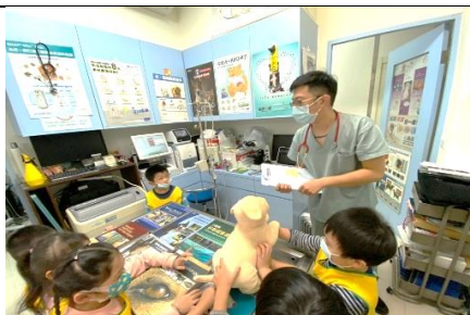
知道小狗小貓的打針的地方