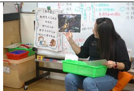
介紹動物醫院會做的事情