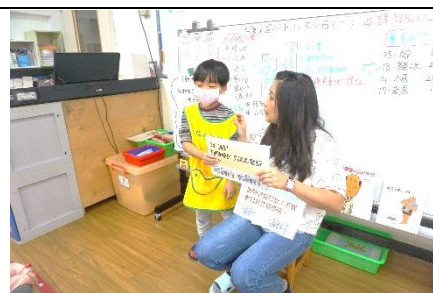
參訪前練習問問題