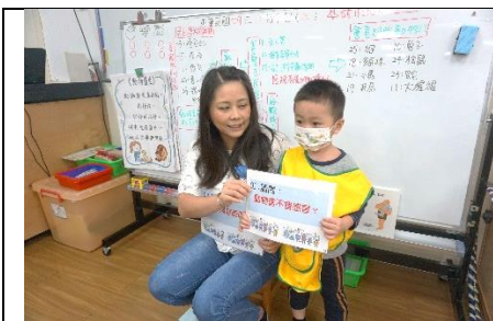
參訪前練習問問題