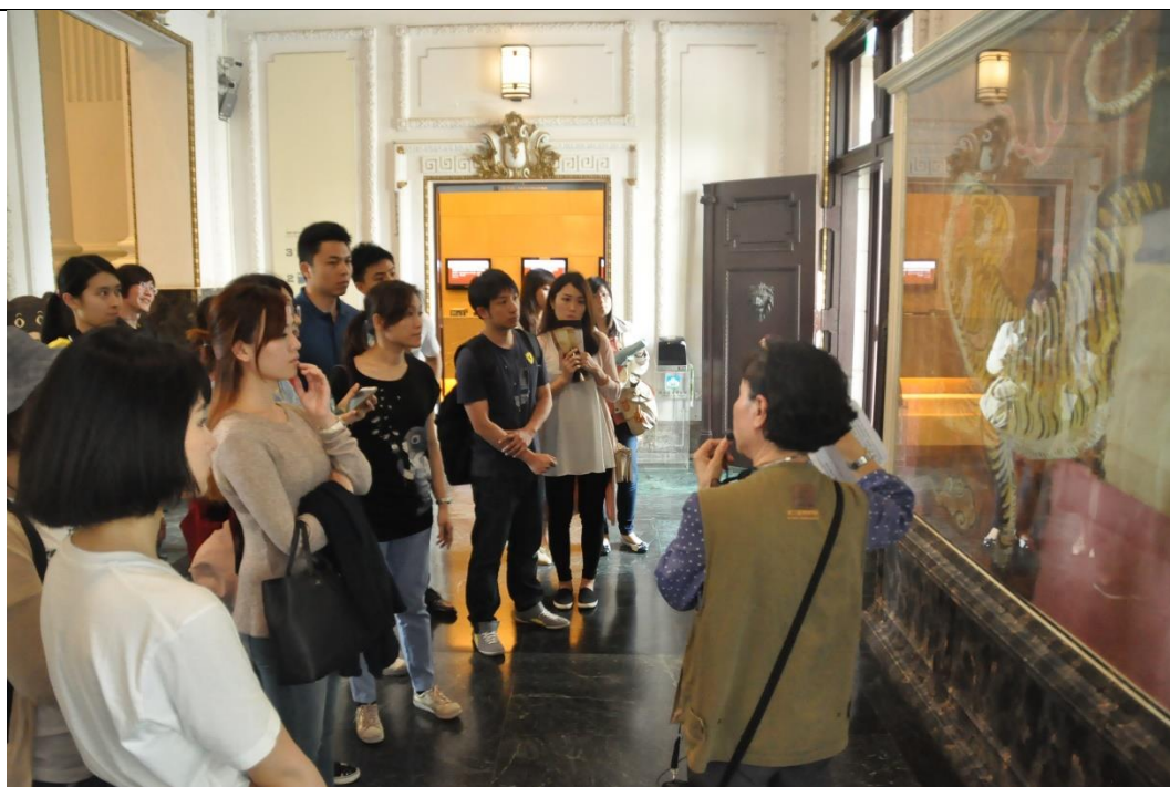
活動說明：教師環境教育精進研習-臺博館-臺灣生物展 日期：105 年 04 月