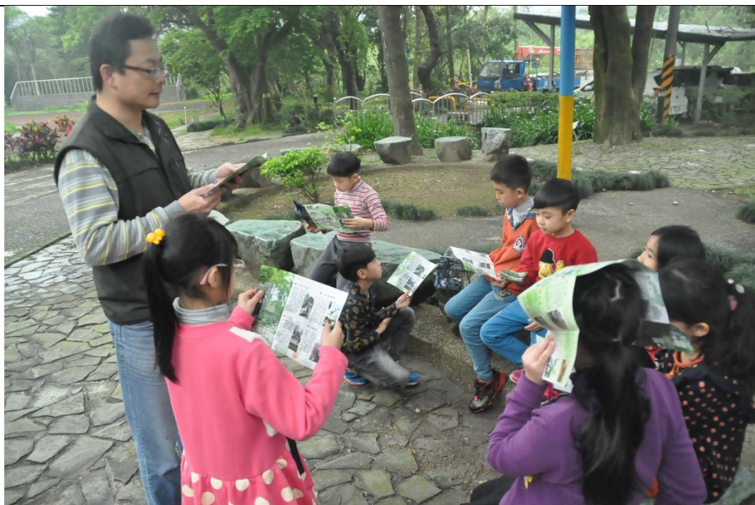
活動說明：校本課程-校園老樹課程手冊-認識校園老樹