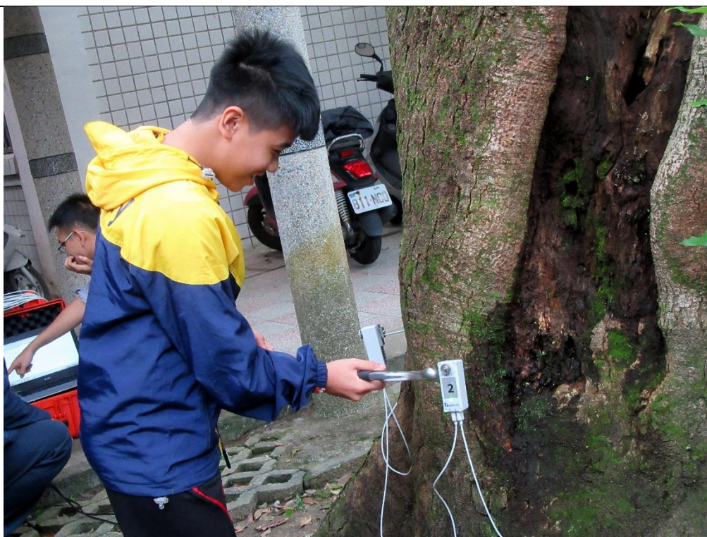
活動說明：參與農業局珍貴老樹病蟲害救治觀察