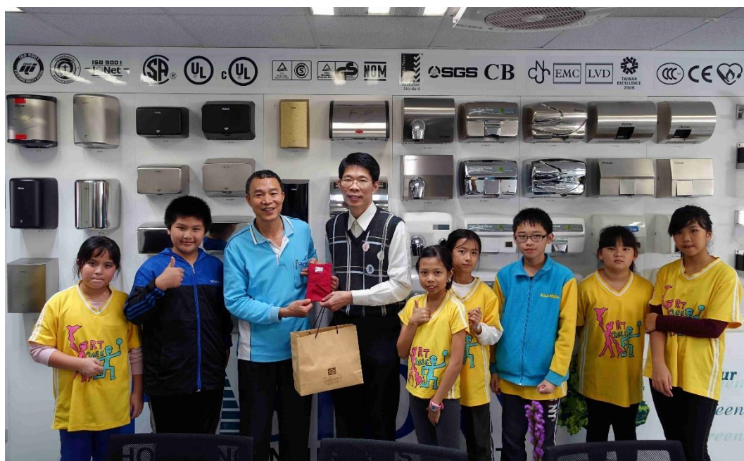
活動說明：2017 網界博覽會專題計畫-地方企業參訪