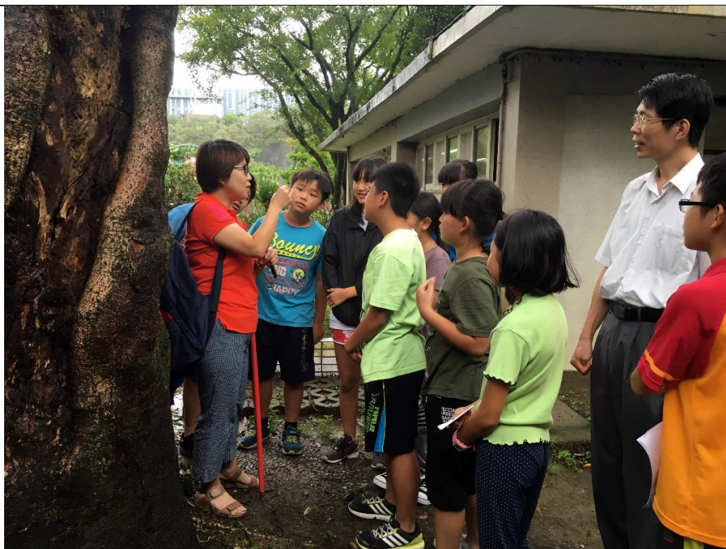
活動說明：認識校園老樹及病蟲害防治