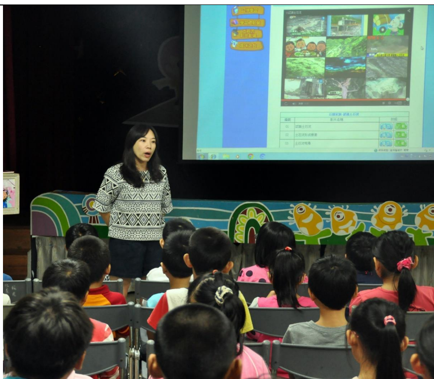
活動說明：土石流災害宣導