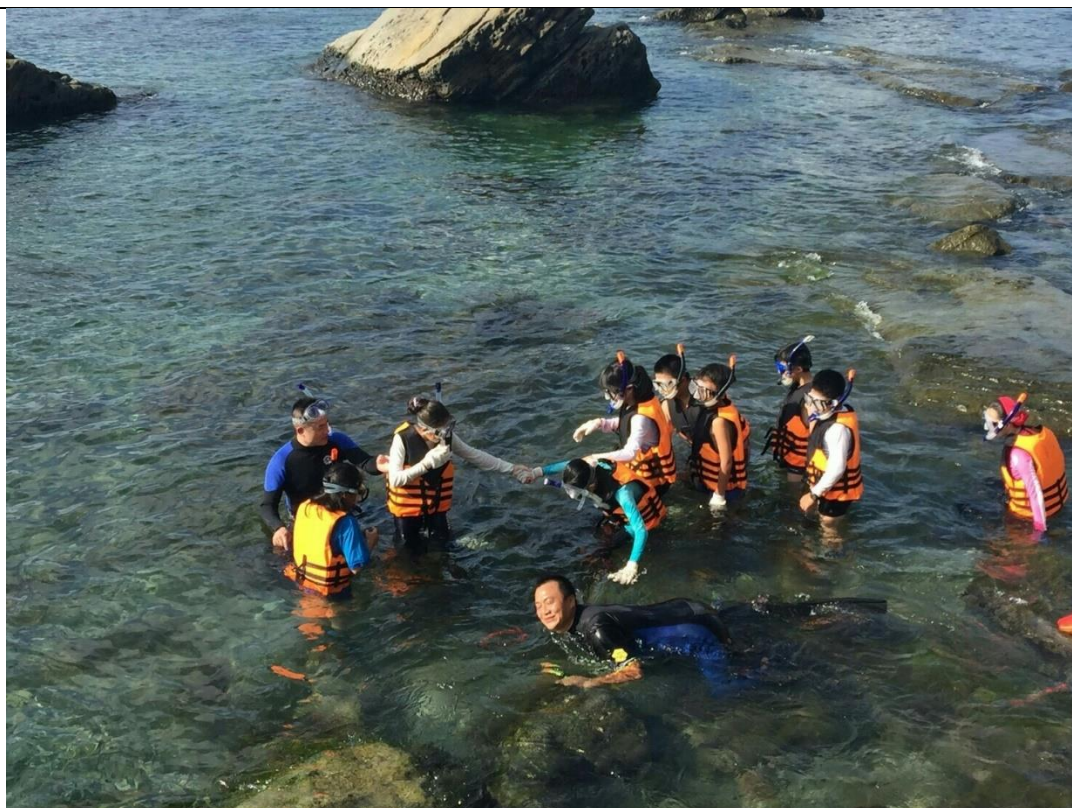
活動說明：主人翁童軍活動-浮潛觀察-海洋教育