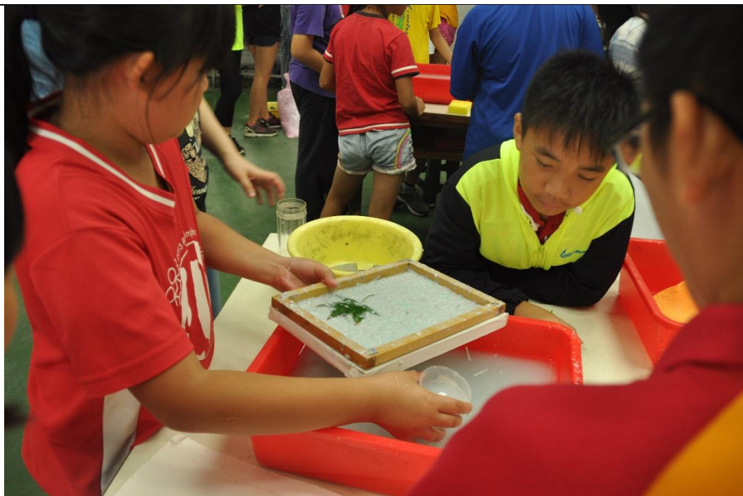
活動說明：藝文領域公開課-手抄紙創作加入校內植物