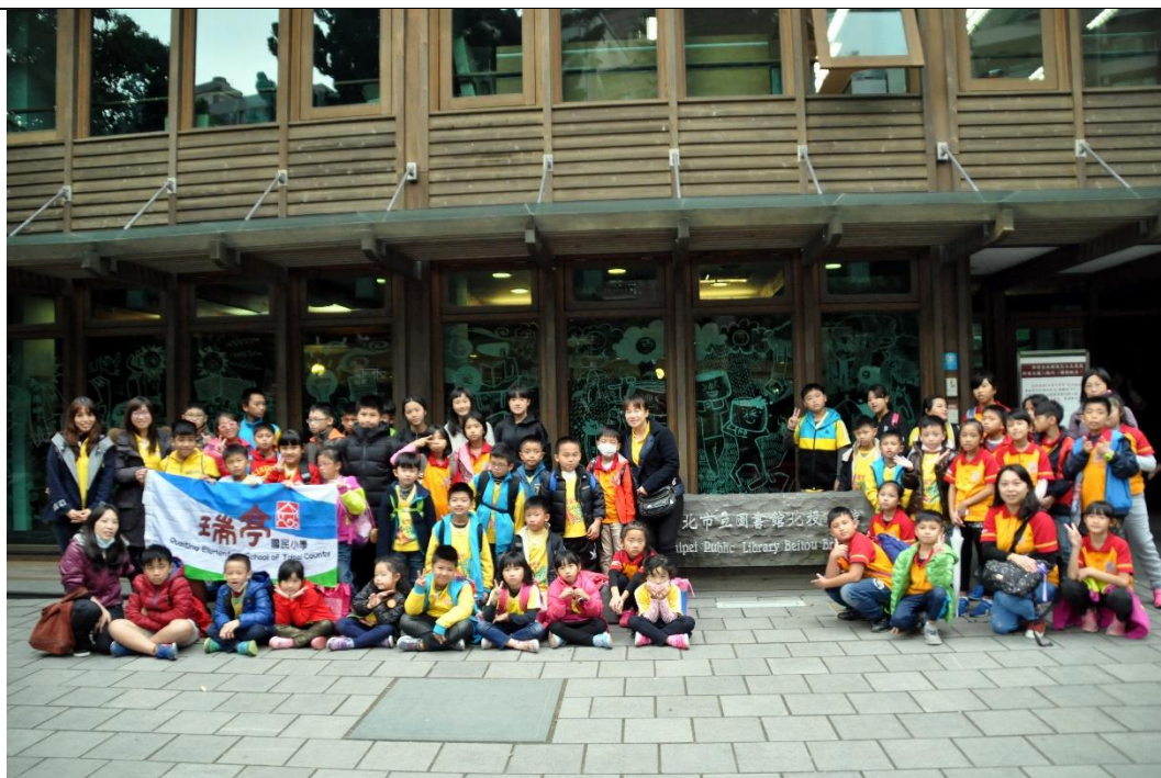
活動說明：戶外教育-綠建築參訪-北投圖書館