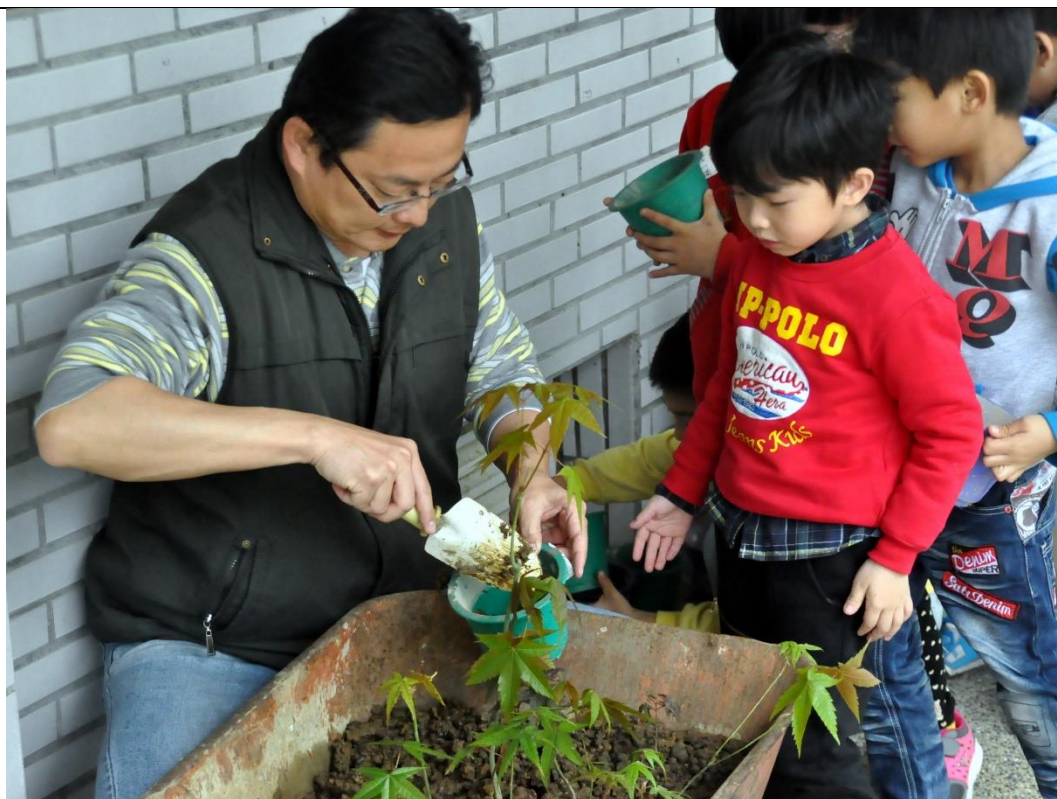
活動說明：校園特色植物課程-認識槭樹與認養