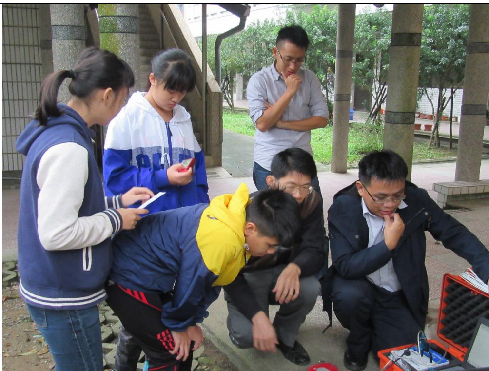
活動說明：農業局協助珍貴老樹病蟲害救治觀察-專家解說 日期：105 年 12 月