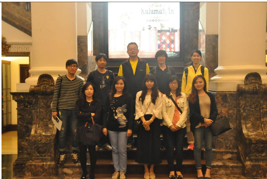
活動說明：教師環境教育精進研習-臺博館-臺灣生物展 日期：105 年 04 月