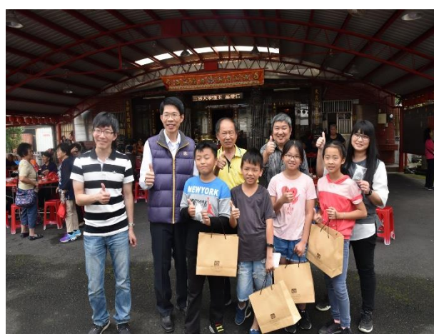
藉由社區老人共餐的場合，贈送艾草包並關懷社區長輩