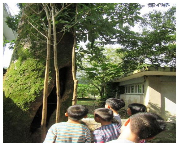
校園老樹生態介紹與體驗