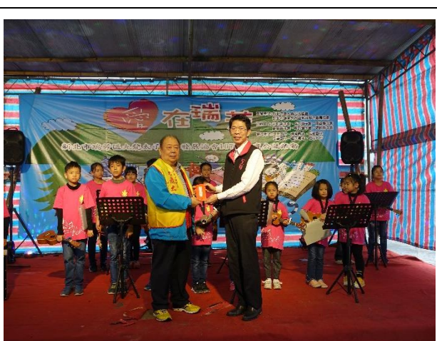
參與愛在瑞芳活動

(三)創新作為或優良事蹟(選填)- 科技與食農：結合「用愛(i)轉動，數位瑞亭計畫」，藉助瑞芳獅子會，購置平板電腦，結合行動學習，指導學生製作食農語音記錄，進而利用AR(擴增實境)技術，設置可食地景AR互動點，以科技技術記錄並推展環境教育教學成效。