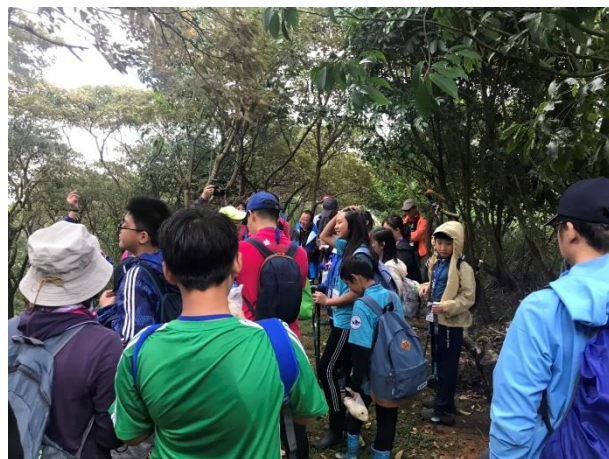
參與豐珠國中登合歡山：楊廷里古道