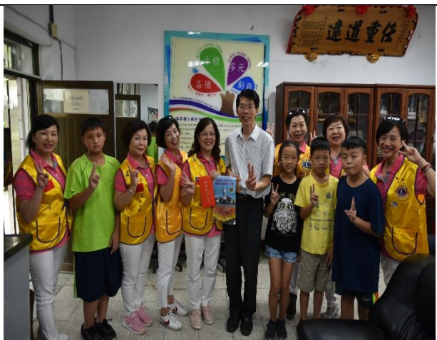
獅子會到校頒獎與鼓勵學生