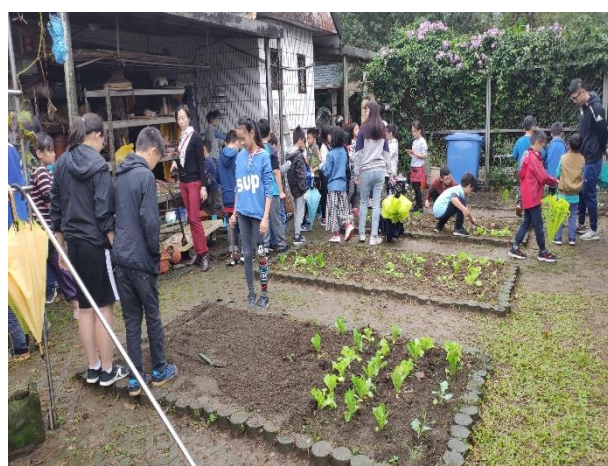
有機菜園與農場營造