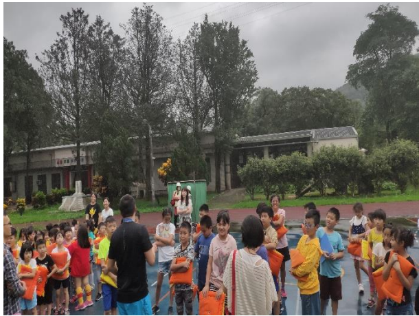
防災教育實施演練