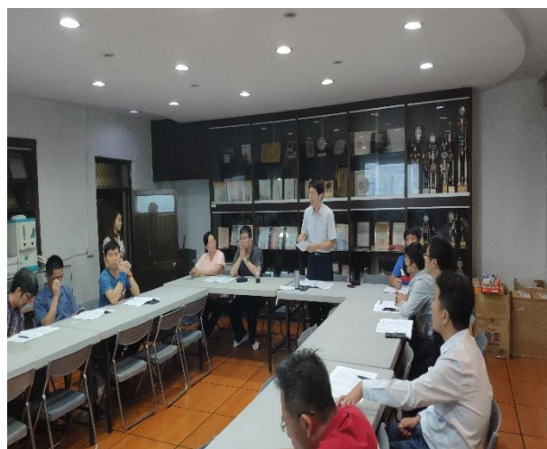
家長會討論節能減碳、交流環境議題、改善校園環境