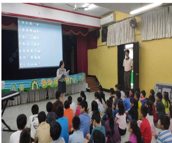
社區人員到校宣導