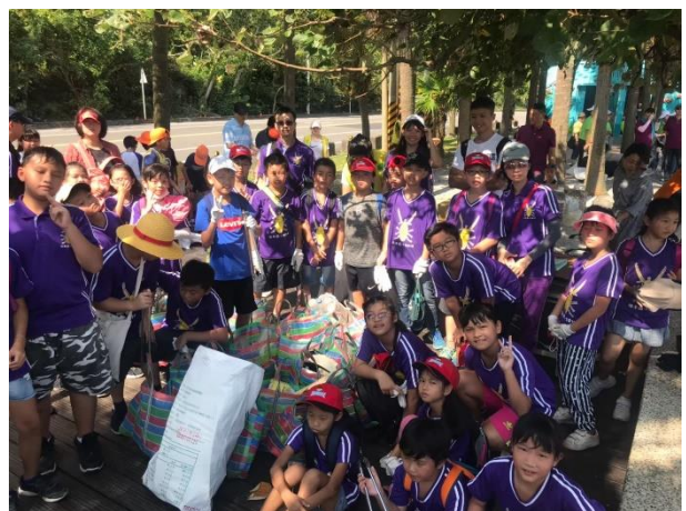
東北五校淨灘活動