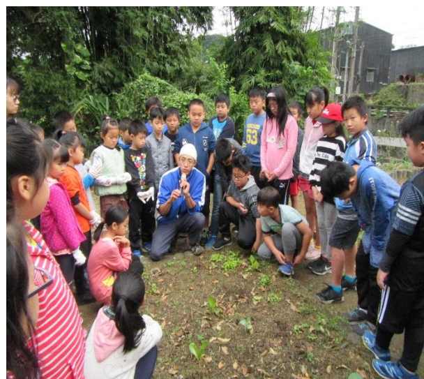
快樂小農夫：番薯收成