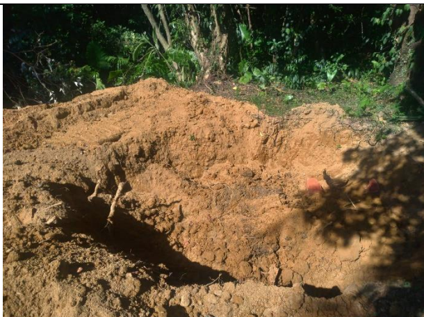
校園樹木褐根病處理