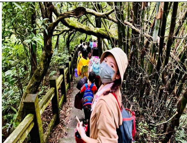
陽明山環境教育課程