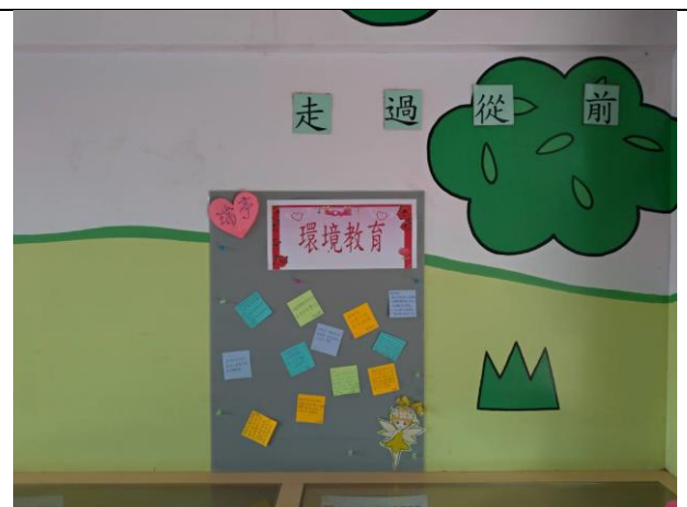
環境教育增能研習與分享