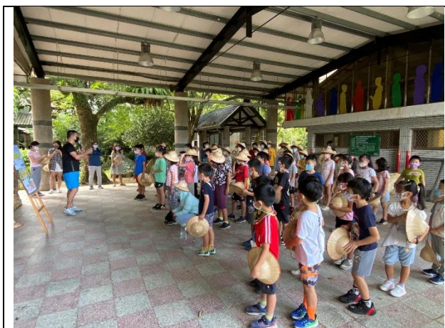
全校性防災教育宣導