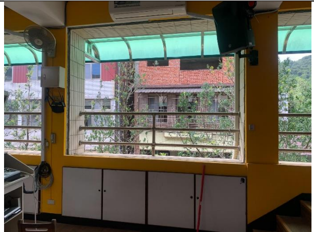
教學環境設備更新