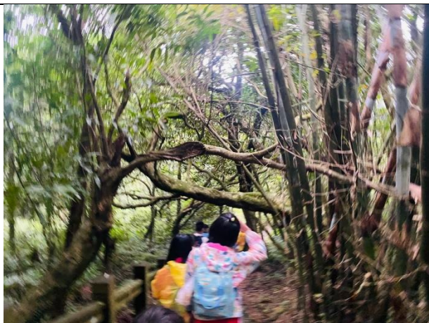
陽明山環境教育課程