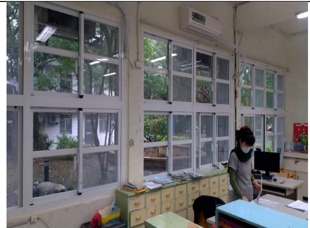
教學環境設備更新