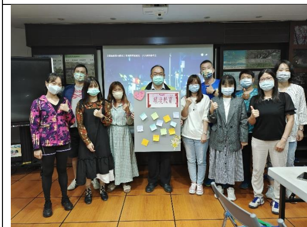
環境教育增能研習與分享