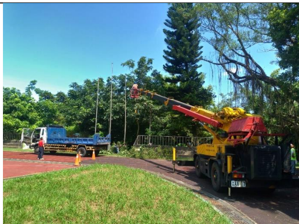
校園樹木褐根病處理