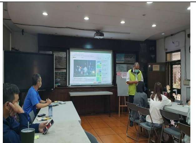
環境教育增能研習與分享