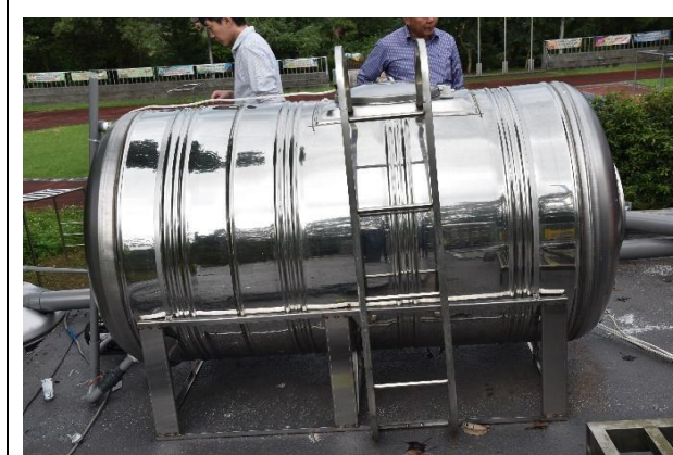
雨水回收系統-沖廁與澆灌