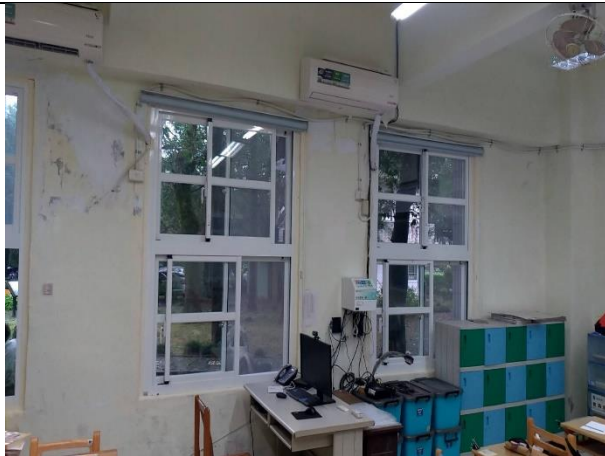
教學環境設備更新