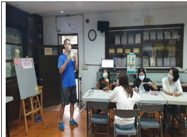
環境教育增能研習與分享