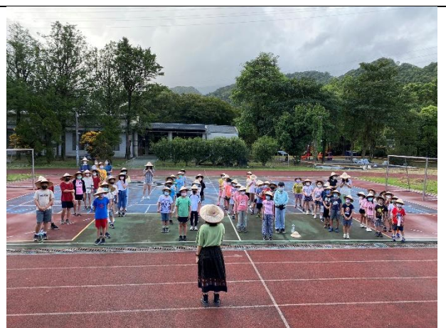
全校性防災教育宣導