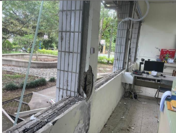
教學環境設備更新